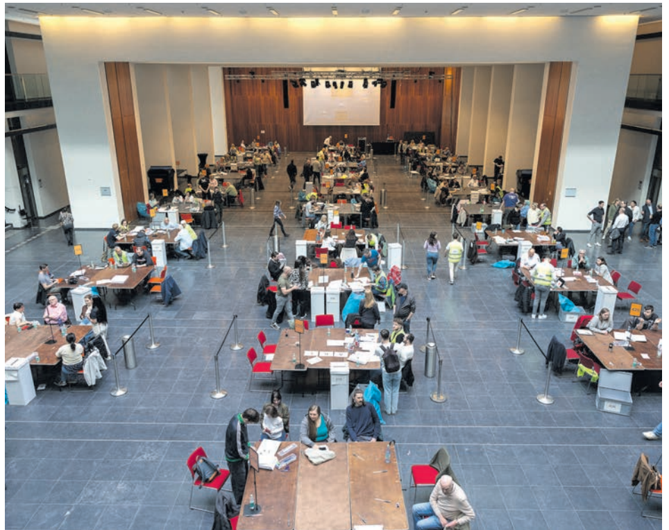
231 Wahlhelferinnen und Wahlhelfer im zum Auszählungsraum umfunktionierten Atrium des Hans-Sachs-Hauses.