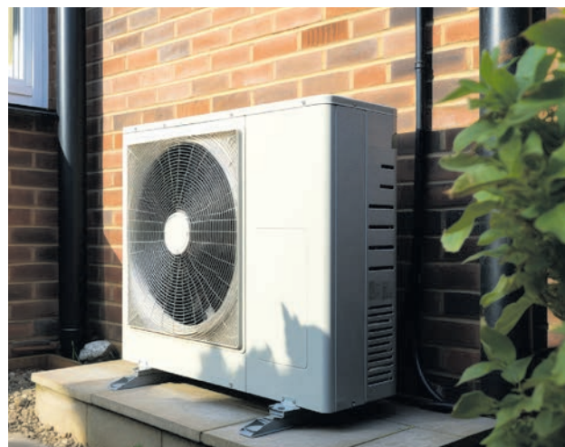
Unter anderem sollte man die Außeneinheit gründlich reinigen.

„Falls Sie dieses Produkt nicht mehr erhalten möchten, bitten wir Sie, einen Werbebotsaufkleber mit dem Zusatzhinweis ‚Keine kostenlosen Zeitungen‘ an Ihrem Briefkasten anzubringen. Weitere Informationen finden Sie auf dem Verbraucherportal www.werbung-im-briefkasten.de .“