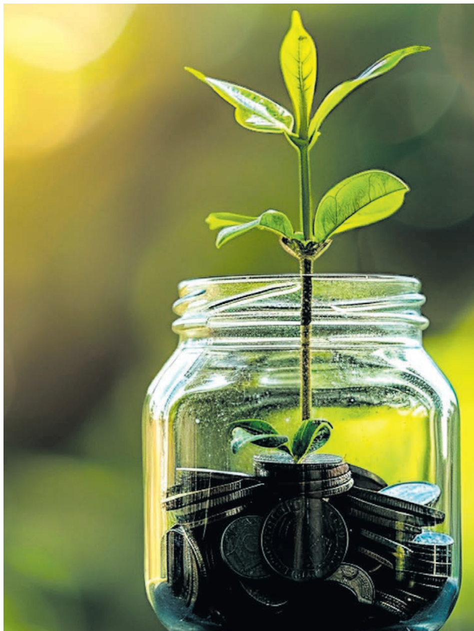
Finanziell wachsen: „Wer Vermögen aufbauen will, muss verstehen, was sich im Hintergrund verändert“.

Mehr Infos unter: www.finexity-group.com .