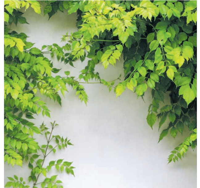
Grün hilft gegen Hitze.

etwa Begrünung auf Balkon- und Fensterbereichen im Rahmen der Mietmöglichkeiten. Schon kleine Veränderungen können das Wohnklima spürbar verbessern.