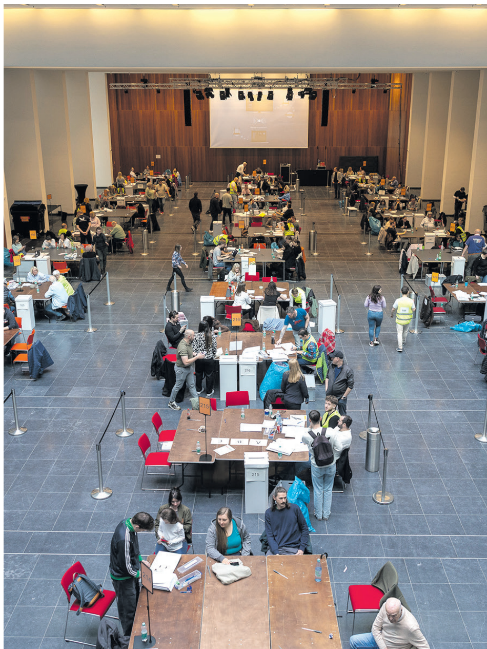
231 Wahlhelferinnen und Wahlhelfer im zum Auszählungsraum umfunktionierten Atrium des Hans-Sachs-Hauses.

Konzept beteiligten Kommunen durch. Mehr als vier Millionen Bürgerinnen und Bürger waren aufgefordert bis zum 19. April ihre Stimme für Olympische und Paralympische Spiele abzugeben. Informationen: www.olympia-bewerbung.nrw .